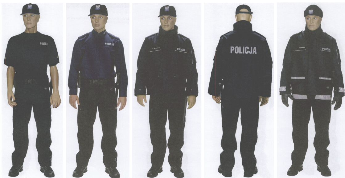
Przykładowe wzory nowego umundurowania służbowego.

Policjanci, którzy pełnią służbę w patrolach pieszych i zmotoryzowanych występują ubrani w tzw. umundurowanie ćwiczebne, tj. czarną kurtkę, czarną bluzę z napisem „Policja” w kolorze czarnym na żółtym odblaskowym tle oraz czarne spodnie i czarne buty „skoczki”, czarną czapkę z daszkiem typu sportowego z wizerunkiem z przodu orła w kolorze srebrnym z napisem „Policja”.