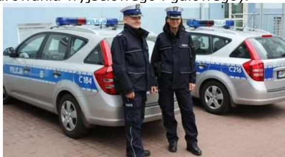
Nowe oznakowanie radiowozu oraz nowe mundury

Oprócz umundurowania służbowego policjanci w zależności od okoliczności zakładają umundurowanie wyjściowe tj. niebieską marynarkę, białą koszulę, krawat, czapkę gabardynową, granatowe spodnie i czarne pantofle. Na specjalne okazje np. uroczystości, awanse, obowiązuje umundurowanie galowe, różniące się od wyjściowego tym, że do munduru przypinany jest sznur galowy. W gorące dni regulamin mundurowy zezwala na występowanie w niebieskiej koszuli bez krawata (w przypadku umundurowania służbowego) lub białej koszuli z krawatem (w przypadku umundurowania wyjściowego i galowego).